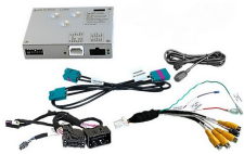
Ohne Navigation - 26 Pin