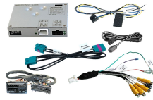
Mit Navigation - 31 Pin