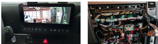
MBUX mit Navigation 31 Pin Stecker

Interface für Rückfahrkamera Nachrüstung für MB Actros 5 mit MBUX + Multimedia Cockpit Code J6B/J6C 10,25Zoll und Navigation J2V. Unabhängig ob Kameravorrüstung- Code: J9P/J9J oder keine Kameravorrüstung – wichtig das ein MBUX verbaut ist, dann ist das Kamerabild im Vollbildmodus.